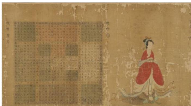
Палиндром китайской поэтессы Су Хуэй

А можете себе представить поэму, которая написана палиндромами? А знаете ли вы, что такая поэма существует! Жившая в 4 веке китайская поэтесса Су Хуэй создала поэму-палиндром, которая представляет собой квадрат из иероглифов размером 29×29. Эту поэму можно прочитать 2 848 способами, путешествуя по квадрату вправо или влево, по горизонтали, вертикали и даже диагонали.