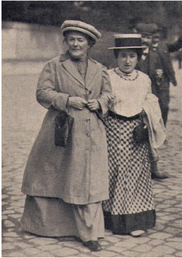
Роза Люксембург (слева), Клара Цеткин (справа)

8-ое марта — это международный женский день и пускай каждый из нас слышал об этом празднике, не каждый сможет ответить на вопрос о том, как и где он возник? И кто поспособствовал его возникновению? На эти и многие другие вопросы я сегодня вам поведаю.